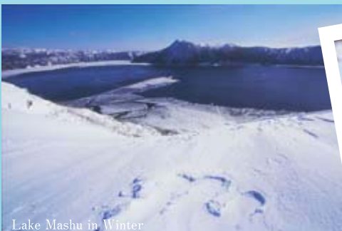
Lake Mashu in Winter