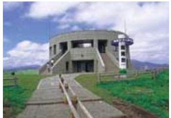
開陽台●靠近中標津機場的展望勝地。如果天氣好，從這裡可以遠眺北方四島。