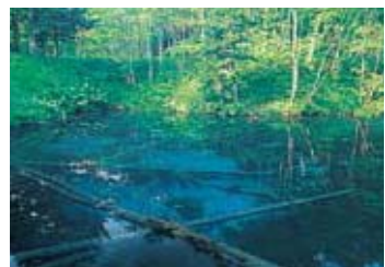
神之子池●登往裏摩周展望台途中的一個小池子。據說池中的水是從摩周湖的地下湧出來的。