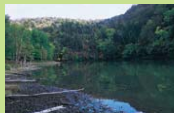
湯沼●古硫磺火山成為死火山之後，在火山口底部形成的沼池，現在仍有溫泉湧出。這裡也是橇熊生息的秘境。