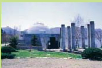
屈斜路古丹愛奴民俗資料館●館內詳細介紹屈斜路湖週邊的地形成因、愛奴人的生活和古丹的歷史等。