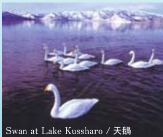
Swan at Lake Kussharo / 天鵝