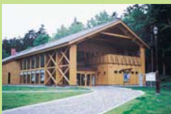
川湯環保博物館●通過這裡的展示設備可以了解週邊的自然情況和歷史知識，工作人員還會向您詳細解說不同季節的觀光知識。