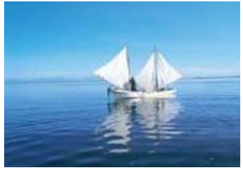
野付半島●6月～8月，乘坐傳統的打瀨舟可體驗北海捕蝦。