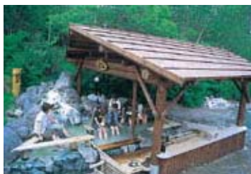
川湯溫泉街的足湯