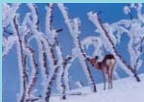
Deer at lake Mashu / 摩周的鹿