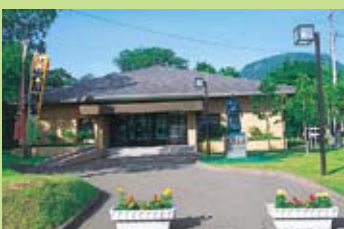
川湯相撲紀念館●紀念館是為了歌頌優勝32次、橫綱在位10年的著名相撲選手“大鵬”而建立的，昭和58年建設完成。

時刻表以弟子屈為基點，詳細標註了方位、線路、國道及道道的路線名、大致距離等。時刻表的刻度單位是10公里。更準確的距離、目的地之間的距離與時間等信息請參照右邊的“弟子屈週邊駕車指南”。另外，記載的地圖和時刻表的位置關係並不一定完全一致，最好通過地圖或車載導航器進行再確認。