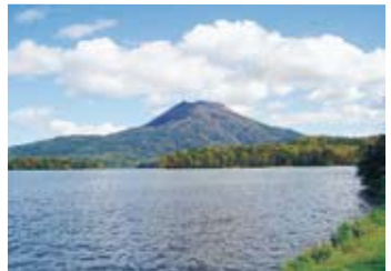
阿寒湖●從湖畔可以看到阿寒岳。從登山口到山頂約需要3小時。