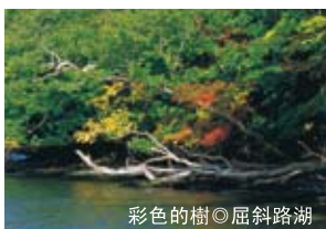
彩色的樹◎屈斜路湖