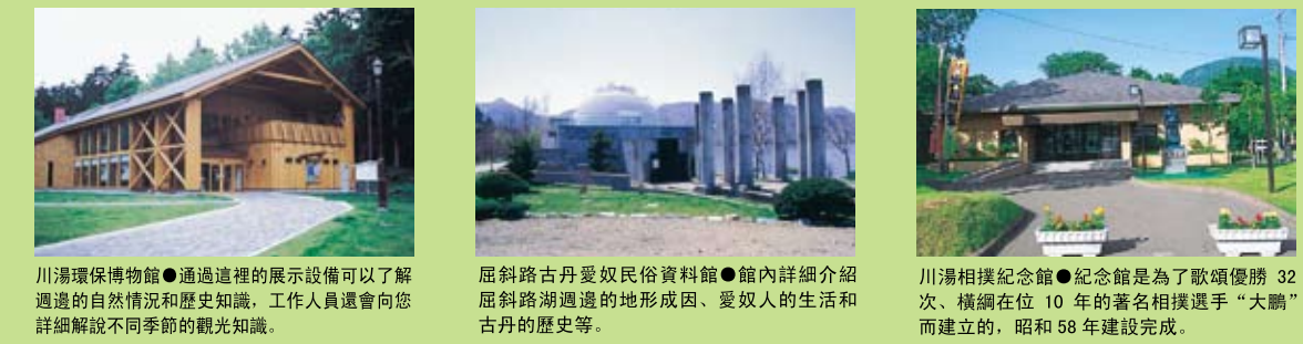
川湯環保博物館 ● 透過這裡的展示設備可以了解週邊的自然情況和歷史知識。工作人員還會向您詳細解說不同季節的觀光知識。 屈斜路古丹愛奴民俗資料館 ● 館內詳細介紹屈斜路湖週邊的地形成因、愛奴人的生活與古丹的歷史等。 川湯相撲紀念館 ● 紀念館是為了敬頌優勝 32 次、橫綱在位 10 年的著名相撲選手“大鵬”而建立的，昭和 58 年建設完成。

● 列車時刻表的使用方法 時刻表以弟子屈為基點，詳細標註了方位、線路、國道及道道的路線名、大致距離等。時刻表的刻度單位是 10 公里。更準確的距離、目的地之間的距離與時間等信息請參照右邊的“弟子屈週邊駕車指南”。另外，記載的地圖和時刻表的位置關係並不一定完全一致，最好通過地圖或車載導航器進行再確認。