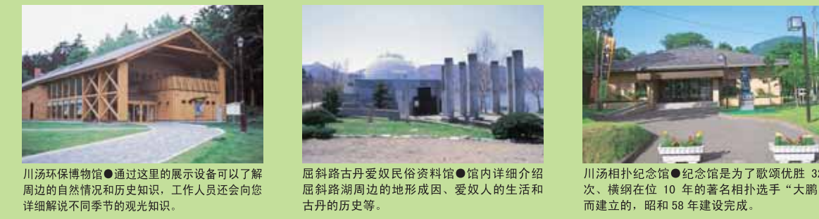
川汤环保博物馆 通过这里的展示设备可以了解屈斜路湖周边的自然情况和历史知识。工作人员还会向您详细介绍不同季节的观光知识。 屈斜路古丹爱奴民俗资料馆 馆内详细介绍屈斜路湖周边的地形成因、爱奴人的生活和古丹的历史等。 川汤相扑纪念馆 纪念馆是为了敬祝优胜 32 次、横纲在位 10 年的著名相扑选手“大鹏”而建立的, 昭和 58 年建设完成。

列车时刻表的使用方法 时刻表以弟子屈为基点, 详细标注了方位、线路、国道及道道的路线名、大致距离等。时刻表的刻度单位是 10 公里、更准确的距离、目的地之间的距离与时间等信息请参考右边的“弟子屈周边驾车指南”。另外, 记载的地图和时刻表的位置关系并不一定完全一致, 最好通过地图或车载导航器进行再确认。