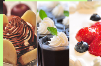
夕食後はデザート