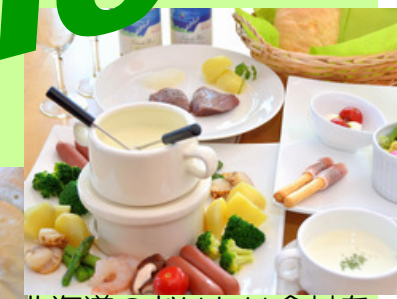
北海道のおいしい食材を