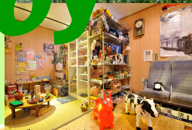
図書コーナー、鉄道グッズにおもちゃ箱