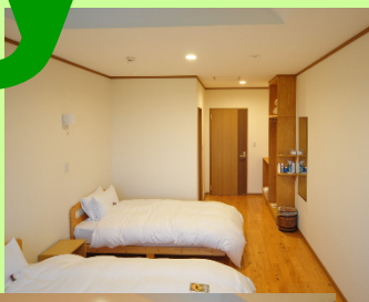
全室 北海道ビュー