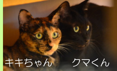
キキちゃん クマくん