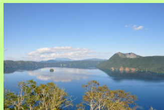
道東の湖、 満天の星、 動物たち、鳥たち