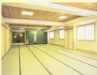
宴会場(カラオケ完備)