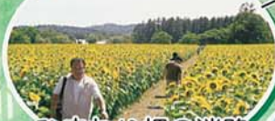
ひまわり畑の迷路