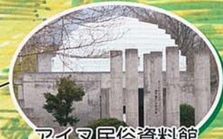
アイヌ民俗資料館

ポンポン山 仁伏より約2キロ、18時間 のハイキング。 山の上で地面をたたくと ポンポン音がする。 冬でもコオロギが鳴く不 思議な山。