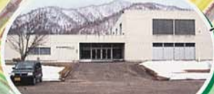
屈斜路研修センター