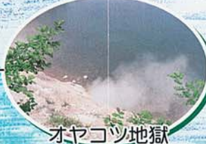
オヤコツ地獄 一周約2.5キロの 散歩ができる。