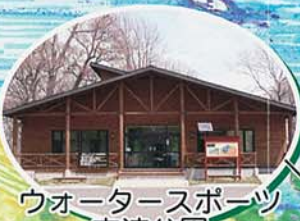
ウオータースポーツ 交流公園