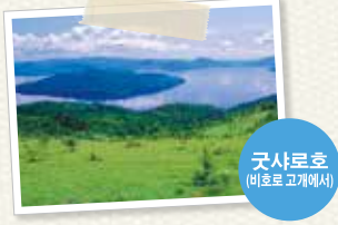
굿사로호 (비호로 고개에서)